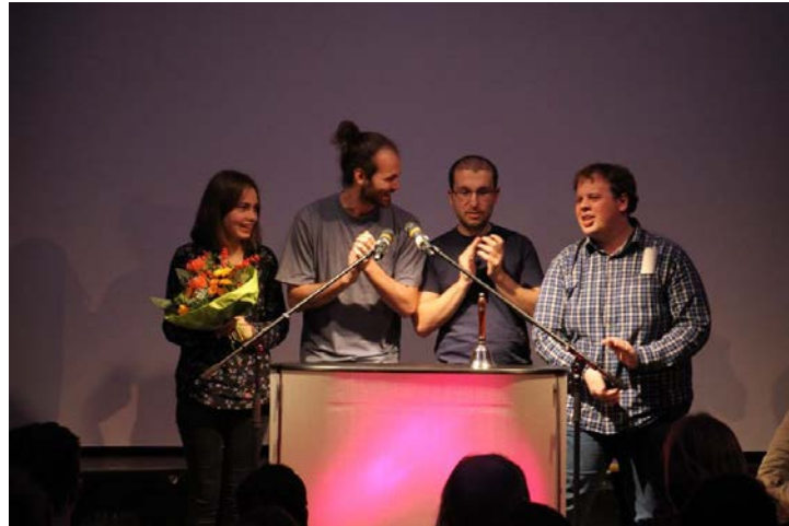
Die Sieger des Poetry Slams 2015

Regelmässige Informationen gibt es im Vorfeld des Poetry Slams über unsere Facebook-Seite. Werdet einfach Fan von https://www.facebook.com/PoetrySlamAschaffenburg/